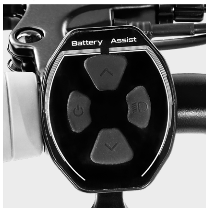
LED waterproof, sviluppato per Platium