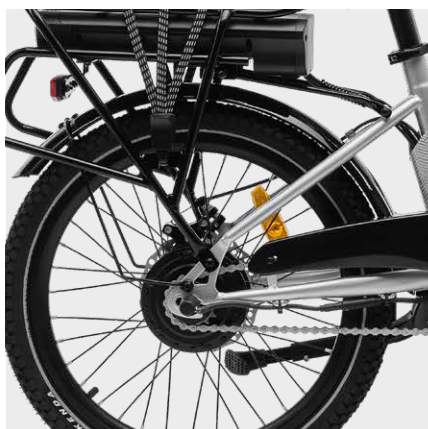
Motore posteriore 250W 45Nm