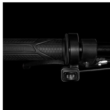
Velocità massima regolabile in 3 livelli