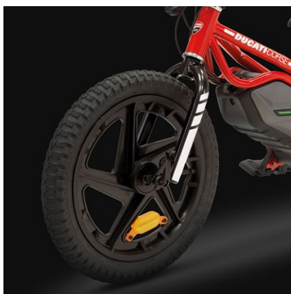
Ruote da 16"