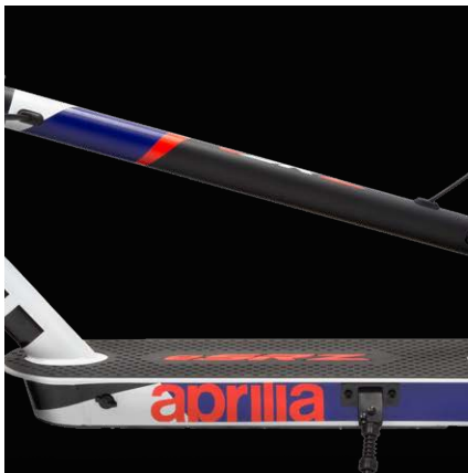
Leggero e facile da trasportare