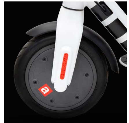
Pneumatici da 8,5" a camera d'aria