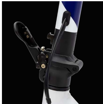
Facile da piegare con gancio lock-in